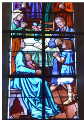
Détail d'un vitrail de l'église Saint-Barnabé du bourg du Courday