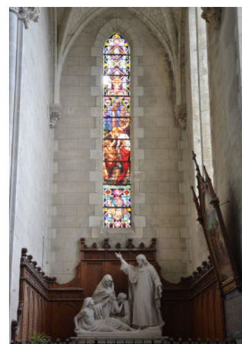
Verrière de la façade Ouest de l'église St-Pierre

L'église située dans le bourg du Courday date de 1860. Tous les vitraux ont été remplacés au début des années 1940 par le maître verrier Razin. Ils apportent une grande luminosité à l'édifice grâce à leurs couleurs chaudes et vives. Dans la nef, ils représentent les moments et les valeurs importantes de la vie chrétienne et sont associés aux quatre vertus cardinales. Dans le chœur, on retrouve la représentation de la vie de Saint Barnabé, patron de l'église.